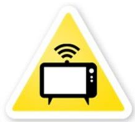
Perspėjimo sistemos patikrinimas

Balsu skelbiamas signalas, įspėjantis apie vykdomą perspėjimo sistemos patikrinimą. Šis signalas skelbiamas taip pat ir kai įvyksta nesankcionuotas sirenų įjungimas. Jis skelbiamas ne vėliau kaip 3 min. nuo įspėjamojo garsinio signalo perdavimo pradžios per valstybės ir savivaldybių institucijų ir įstaigų, kitų įstaigų, ūkio subjektų garsines avarinio signalizavimo sistemas, elektronines sirenas, regioninius ir vietinius transliuotojus.